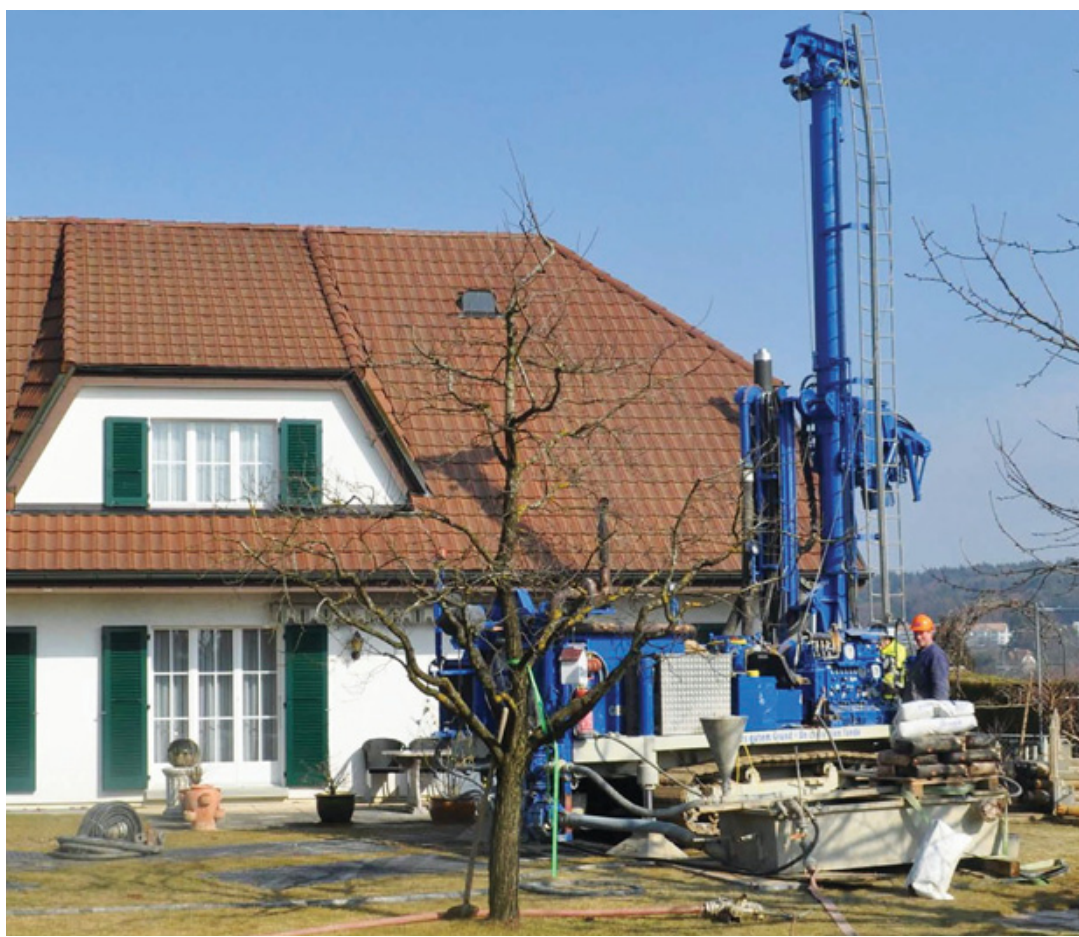
Tout forage doit faire l'objet d'une demande d'autorisation délivrée au cas par cas par les spécialistes cantonaux des eaux souterraines. A Bassins comme dans bien d'autres communes, cette technique n'est pas admise en raison de la nature connue du sous-sol. OFEN/DR - IMAGE D'ILLUSTRATION

Le spécialiste des sous-sols du Pays de Vaud et de l'eau qui y circule rappelle que ce régime d'autorisation au cas par cas a aussi pour but de préserver les propriétaires eux-mêmes. «Certains se souviennent peut-être encore des résultats désastreux de certains forages ayant perforé des nappes d'eau sous pression et qui